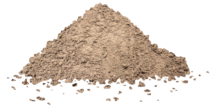
Mélange de sable