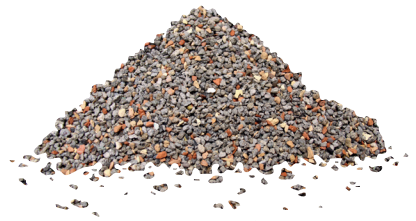
Mélange de granulés