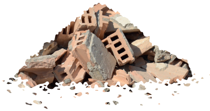
Mélange de déchets issus de la démolition

Avec swissporECORIT, il est possible pour la première fois de combiner une circularité maximale avec une empreinte carbone minimale, tout en conservant les mêmes caractéristiques techniques. Lors du traitement des déchets de construction / de démolition dans le centre de traitement des déchets de construction des entreprises Eberhard (EbiMIK), les matières secondaires sont produites et leur qualité est comparable à celle des matières premières primaires. C'est à partir de ces matières secondaires que l'isolant swissporECORIT est fabriqué.